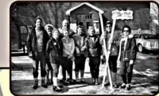
Membres du Laurentian Lodge Ski Club devant l'hôtel de ville de Sainte-Anne-des-Lacs, vers 1980

La Municipalité de Sainte-Anne-des-Lacs est fière de partager de nouveau une partie de ce réseau avec les amateurs de plein air et tient à remercier l'ensemble des propriétaires, grâce à qui ce projet est rendu possible!