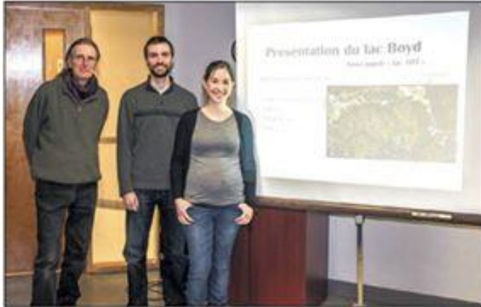
L'Association pour la Protection de l'Environnement des Hautes-Laurentides, APEHL, est à la recherche de bénévoles pour son grand nettoyage du sanctuaire de tortues au lac Boyd à Lac-des-Écorces