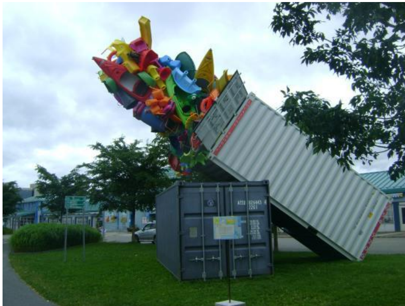
Marché du Vieux-Port de Québec

L'amélioration de la signalisation routière indiquant l'écocentre à partir de la route 117 devrait être priorisé comme moyen d'action. Pourquoi ne pas y installer une belle et grande enseigne indiquant la direction de l'écocentre et le type de matériaux acceptés, par une œuvre signalétique guidant les utilisateurs. Voici un exemple d'une telle œuvre, à Québec :