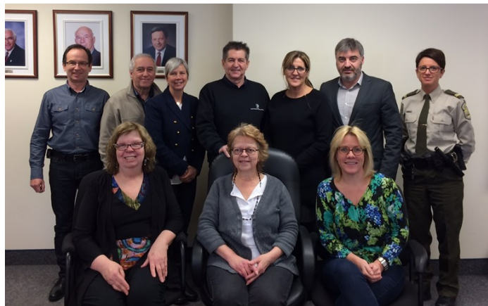
Une partie des membres du conseil d'administration 2015-2016