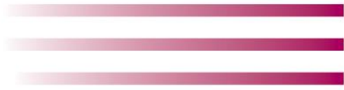
Table des aînés de la MRC des Pays-d'en-Haut