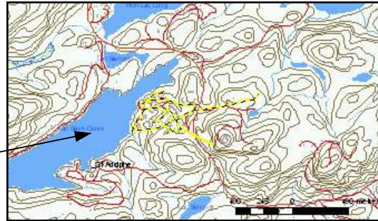
Secteur lac Saint-Denis