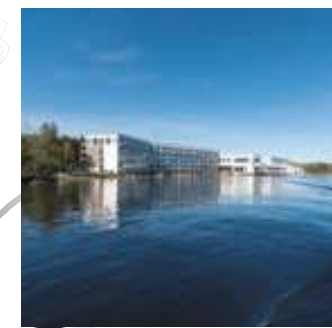
Lac Dupuis