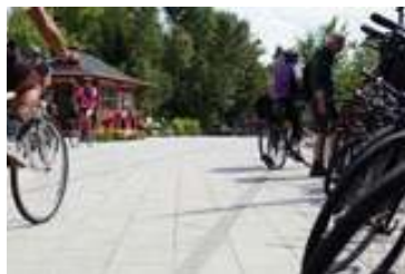
Parc linéaire Le P'tit Train du Nord, secteur vieille gare de Mont-Rolland

This tour starts in Ste-Adèle and will bring you to the enchanting Town of Ste-Marguerite-du-Lac-Masson. Take a few moments to stop at the Violette-Gauthier Pavilion (70 Masson Rd) where you'll be treated to a magnificent view of Lac Masson. Down the road a way, Ville d'Estérel, founded in 1959 by Fridolin Simard, will welcome you. The tour ends at the Mont-Rolland Railway Station, built in 1928.