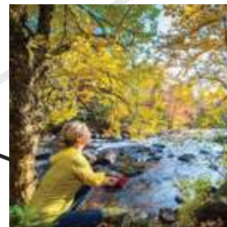
Parc Doncaster