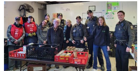
Table anglophone LESAN